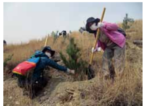
昨春は永寧山でマツを植えた。