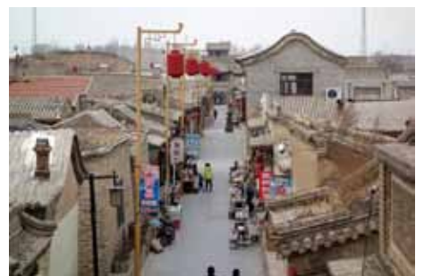
古い街並を観光資源にしながら、そこで営まれる人びとの暮らし。