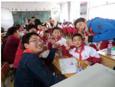
小学校で子どもたちと交流。

25年間積み重ねてきた経験が無駄にせず、生かせる場所をさがして、2016年、大同のすぐ東隣の張家口市蔚県で新しく緑化協力をはじめました。蔚県は大同市広靈県に隣接し、気候・土壌の条件は大同とほぼ同じ。この10年ほどで急速に開発がすすんだ大同と違い、歴史を大切にしている、古いものや文化が残った街並み、人びとの暮らしが懐かしさを感じさせます。県城の旧市街に散在する社寺・史跡や、農村部に多くのこる古堡、打樹花など、みどころはたくさんあります。なにより、植樹の余地がたくさん残っているのが嬉しいところです。