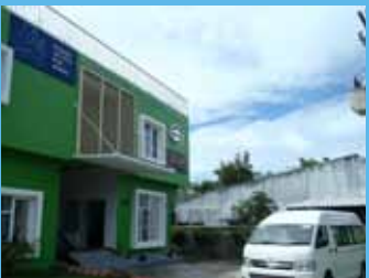
宿泊所、幼稚園兼津波避難施設