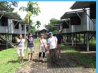
3000人が暮らした避難所跡