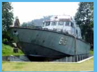
2km内陸に流された警備艇