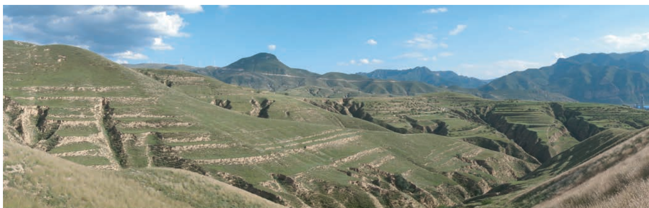
蔚県柏樹郷永寧寨村の造林予定地

緑の地球ネットワーク (GEN) は、1992年に中国山西省大同市の黄土高原で緑化協力をはじめて以来、失敗も成功も、さまざまな経験を積み重ねてきました。大同は、中国が緑化に力を入れるようになったこともあって25年間で見違えるように緑が濃くなり、いまや新しく植える場所を見つけることがむずかしいほどです。そこで、お隣の河北省張家口市蔚県で、2016年度から緑化協力をはじめることになりました。2017年4月のツアーは、蔚県での第1回のスタディツアーです。植樹はもちろん、蔚県の歴史と文化にふれる、参加者誰もが初めての記念すべきツアーに、ぜひご参加ください。