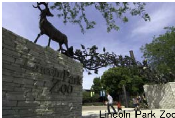
Lincoln Park Zoo

ブルックフィールド動物園 は、シカゴ動物学協会が運営する動物園です。広大な土地にテーマごとに分かれた展示をしており、大型の室内展示は圧巻。保護活動や学術活動も盛んです。こども動物園やイルカショーも楽しめます。