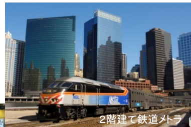
2階建て鉄道メトラ