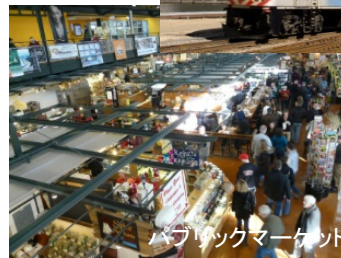
パブリックマーケット