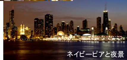
ネイビーピアと夜景