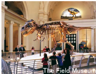
The Field Museum

シェッド水族館 では、「カリブ海の岩礁」でおこなわれるダイバーによる餌付けしながらの解説が人気です。「アマゾン川」や「五大湖」の生物たちの展示もあります。ペルーカの繁殖にも成功しており、ペルーカやペンギンのトレーニングは必見です。