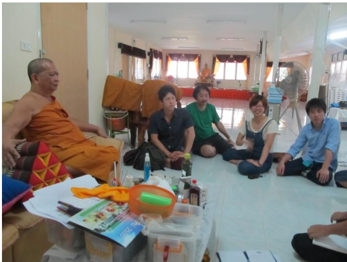
タイ仏教僧侶に心のケアのFM放送局のインタビュー