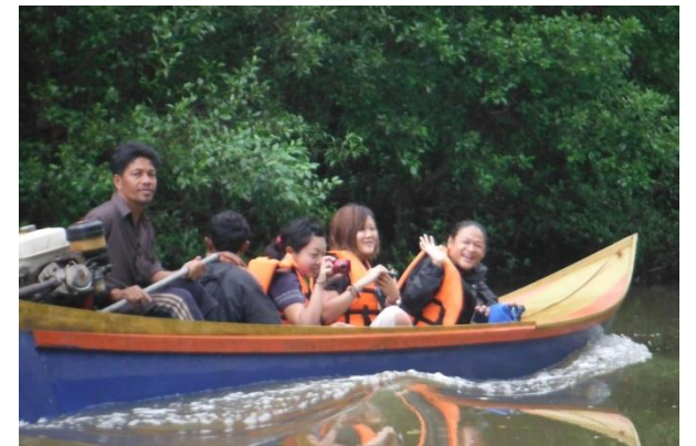
マングローブ体験