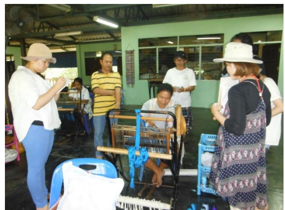
さをりトレーニングセンターで被災者インタビュー