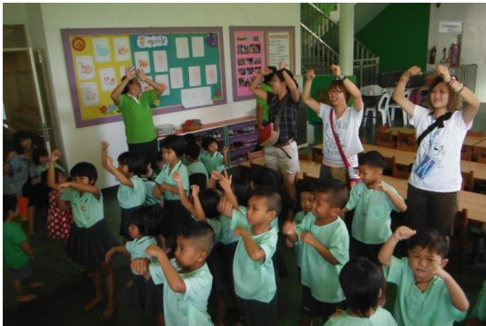
幼稚園で子供たちと朝礼