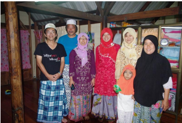
イスラム衣装試着