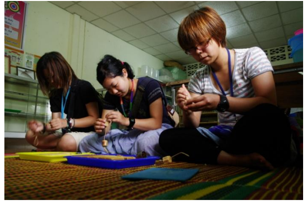
せっけん作り体験