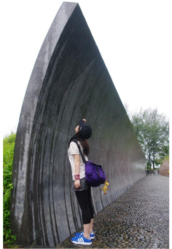
ナムケム村津波メモリアルパーク